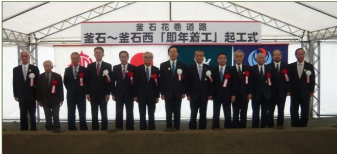
平成24年11月4日、「即年着工」起工式が行われた釜石道の釜石～釜石西も平成30年度中に開通します。

本シンポジウムでは、復興道路・復興支援道路の事業化から着工、そして開通に至るまでの取組をお知らせするとともに、復興道路等のストック効果や今後への期待を市民、県民の皆さんから発信します。