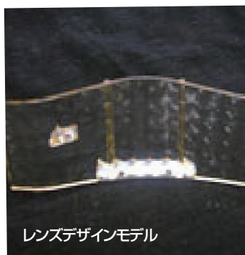
レンズデザインモデル