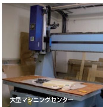
大型マシニングセンター